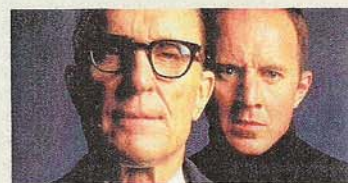
Robert Duvall (Adolf Eichmann) et Peter Malkin (Arliiss Howard).